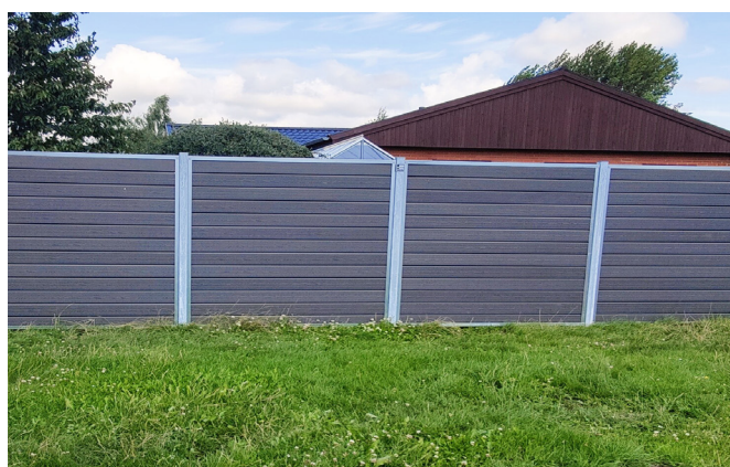
Almindelige kompositbrædder med træstruktur - i antracit.