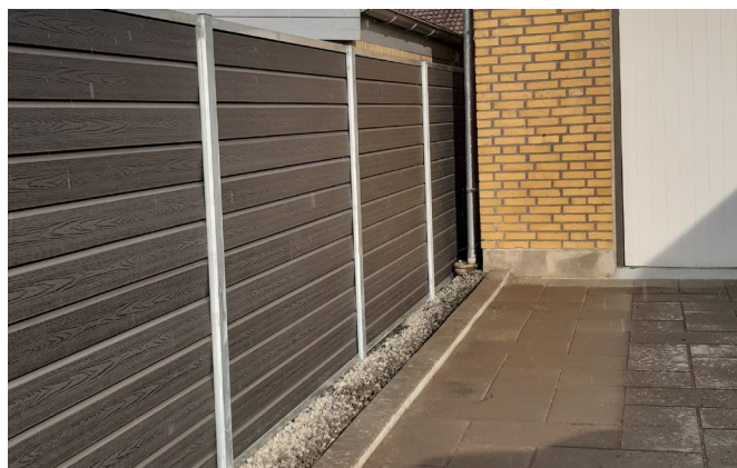
Komposit består af 70% træ og er et godt læhegn.