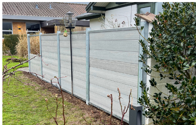
Komposithegn fås i mange farver - her i en råhvid udgave

Vi gør opmærksom på, at denne type komposithegn ikke dæmper støj. Her skal du i stedet vælge vores støjhegn i komposit fra Thomtek. Kontakt os for mere information.