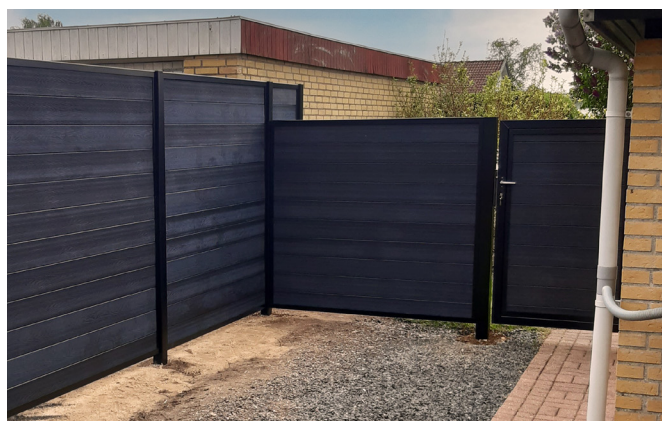
Komposithegn kan til enhver tid tilpasses med port og låge