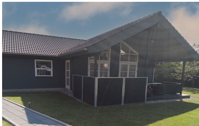
Luksus komposit brædder i farven sort