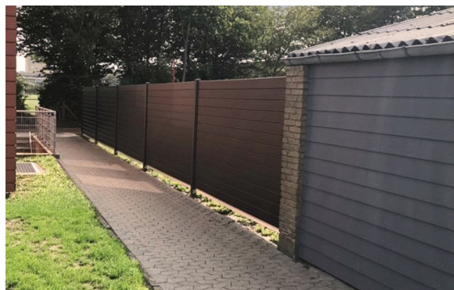
Komposithegn på stolper i samme farve som hegnet