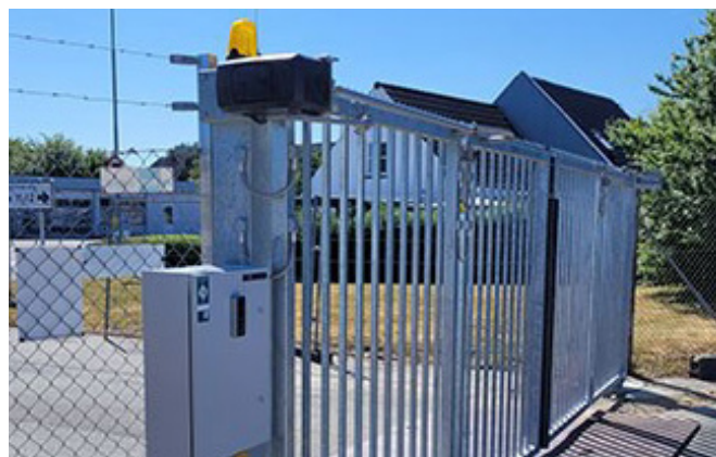
Traffic foldeport med tilpasset adgangskontrol