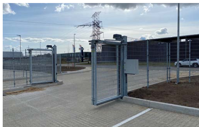
Galvaniseret traffic foldeport med hjættænder foroven

Porten er beskyttet mod korrosion ved hjælp af varmgalvanisering, og du kan vælge et ekstra beskyttelsesniveau med Duplex-systemet, som kombinerer varmgalvanisering og belægning med polyestercoating for ekstra holdbarhed.