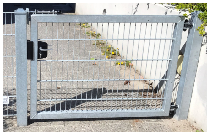
Venus børnehavelåge som overholder alle regler