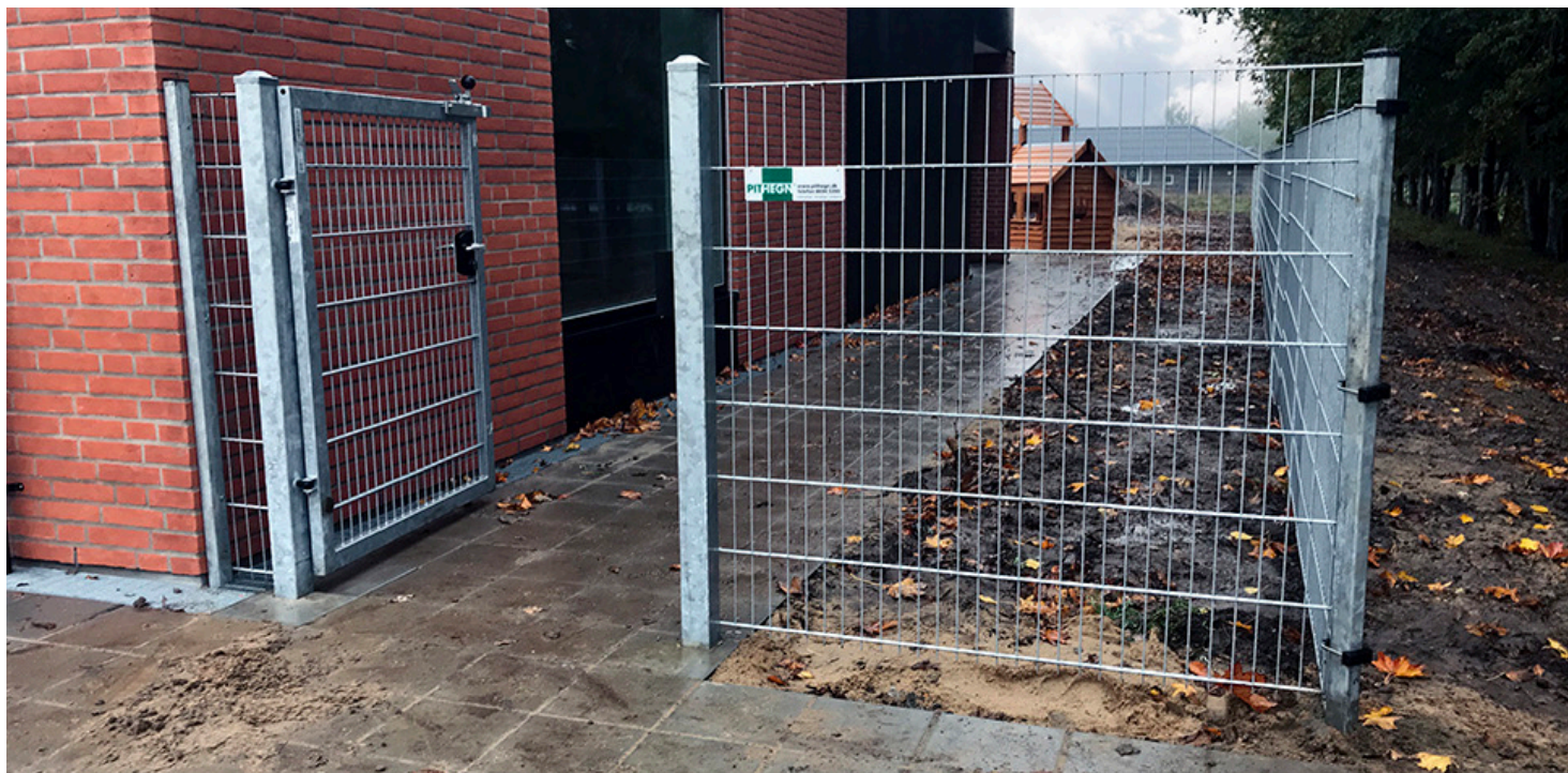
Venus lågen fås helt op til 5 meter bredde.