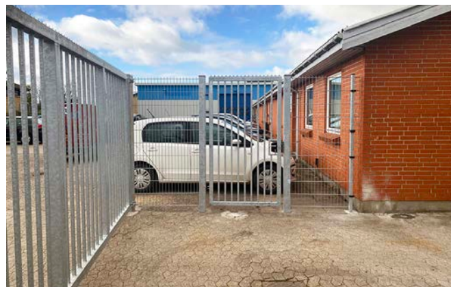
Venus lågen kan tilpasses ethvert ønske i både højde og bredde

Venus lågen kan fås med både baluster- og panel udfyldning. Desuden leveres lågen altid galvaniseret men kan i tillæg pulverlakeres i hvilken farve, man ønsker.