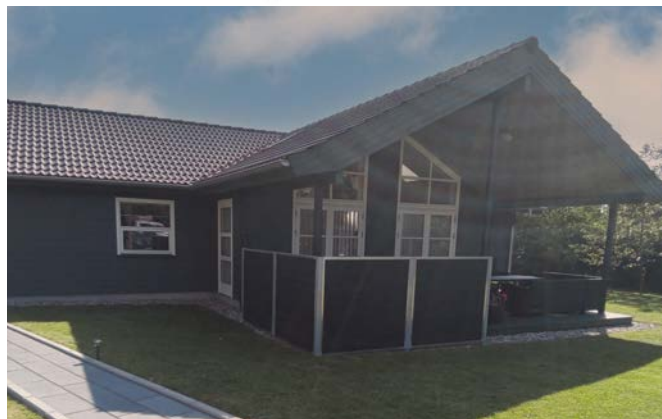
Luksus komposit brædder i farven sort