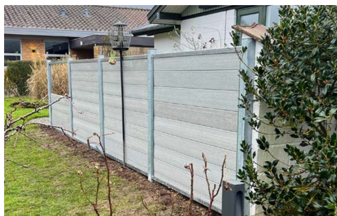
Komposithegn fås i mange farver - her i en råhvid udgave

Vi gør opmærksom på, at denne type komposithegn ikke dæmper støj. Her skal du i stedet vælge vores støjhegn i komposit fra Thomtek. Kontakt os for mere information.