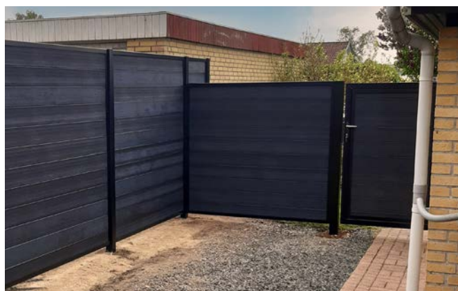
Komposithegn kan til enhver tid tilpasses med port og låge