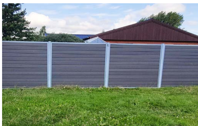
Almindelige kompositbrædder med træstruktur - i antracit.