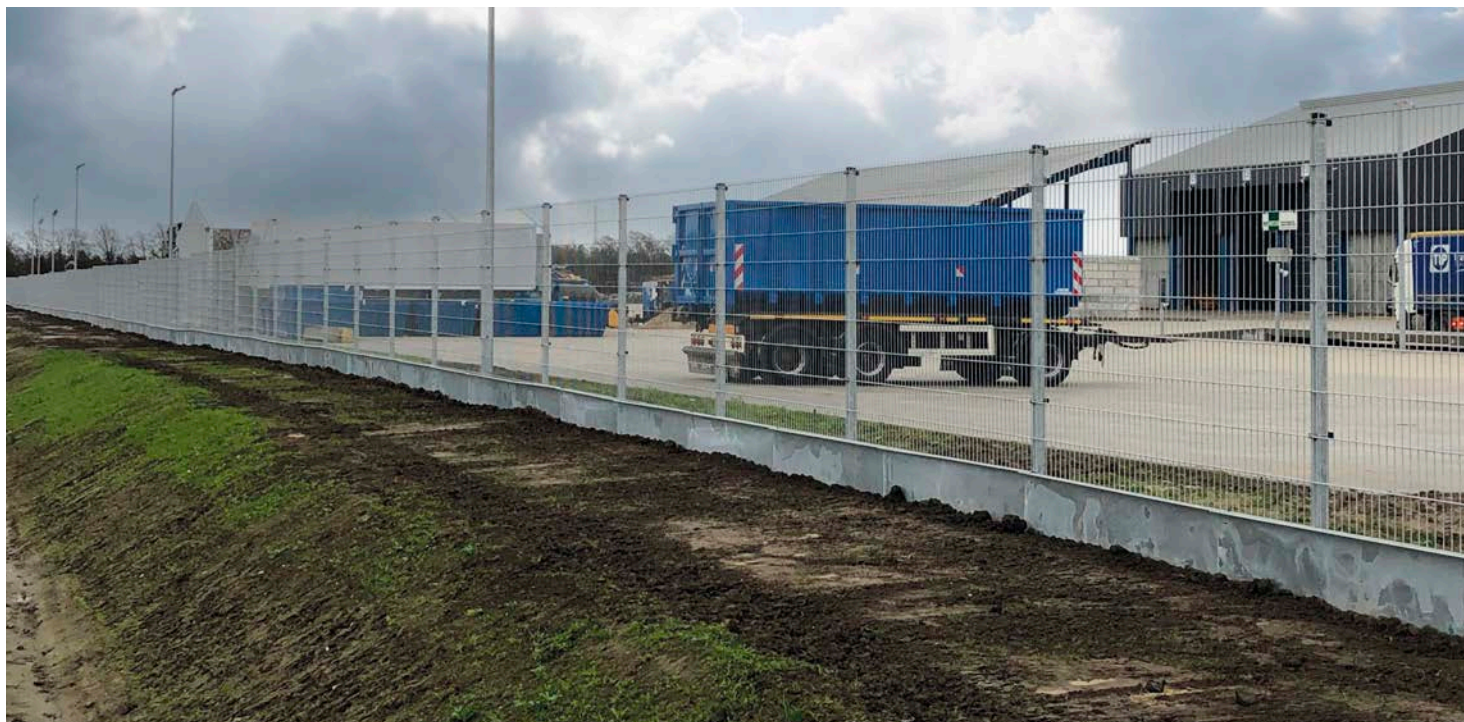
Panelhegn Strong H203 galvaniseret