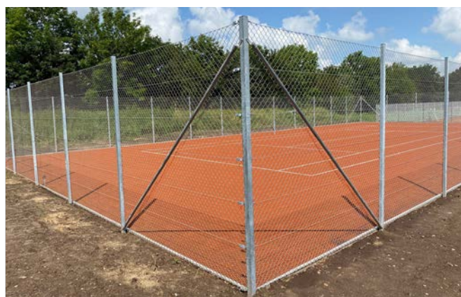
Fletvævshegn til tennisbaner

Når vi bygger komplette hegnsløsninger af fletvæv, anvender vi naturligvis også forskellige porte og låger, som matcher hegnet. Det kunne være en galvaniseret låge eller dobbeltfløjet porte, som fås både med og uden automatik og el-lås.