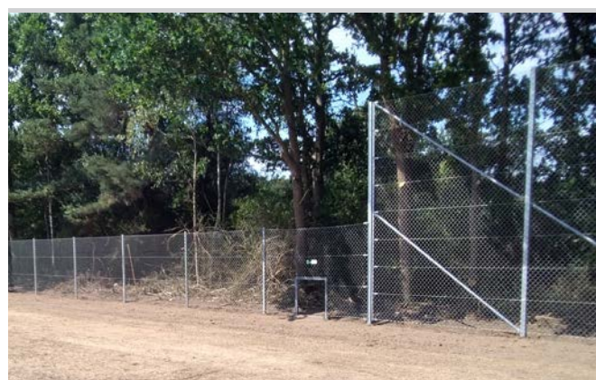
Fletvævshegn kan sammensættes af flere højder