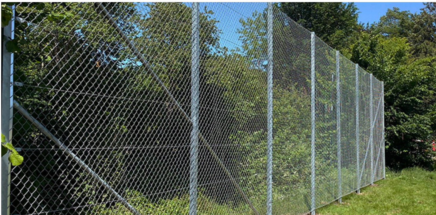
Fletvævshegn fås i mange forskellige højder afhængigt af, hvad behovet er.