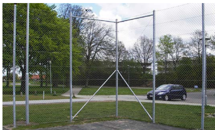
Fletvævshegn med stabiliserede hjørnestolper