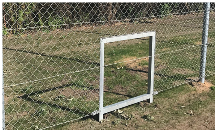
Boldhenterhul til fletvævshegn