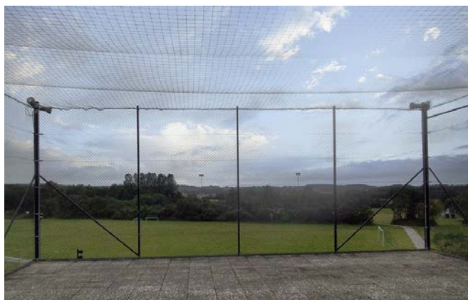
Fletvævshegn med loft af fiskenet